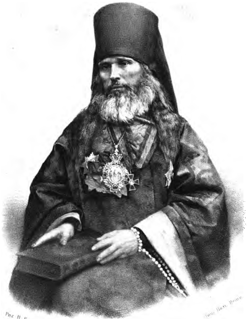
Рис. И. Воробь